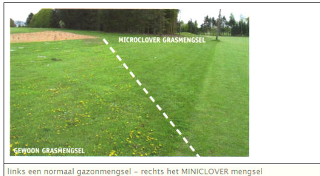
links een normaal gazonmengsel – rechts het MINICLOVER mengsel

Microclover is een zeer kleinbladerig klavertje ( Trifolium repens 'Pirouette') dat samen met de grasplanten groeit in het gazon. Het klavertje is 3-maal kleiner dan de gewone klaver die we wel eens in het gazon zien opduiken. Met Microclover in het gazon, ben je verzekerd van een mooi grastapijt het hele jaar door. Microclover voedt het gras met natuurlijke stikstof, wat de behoefte aan andere (scheikundige of organische) meststoffen wezenlijk vermindert. Samen met het gras, maakt de klaver het gazon zeer gezond, dicht en onkruidvrij.